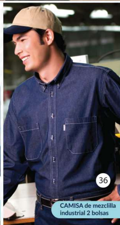
CAMISA de mezclilla industrial 1 ó 2 bolsas con tapa y velcro