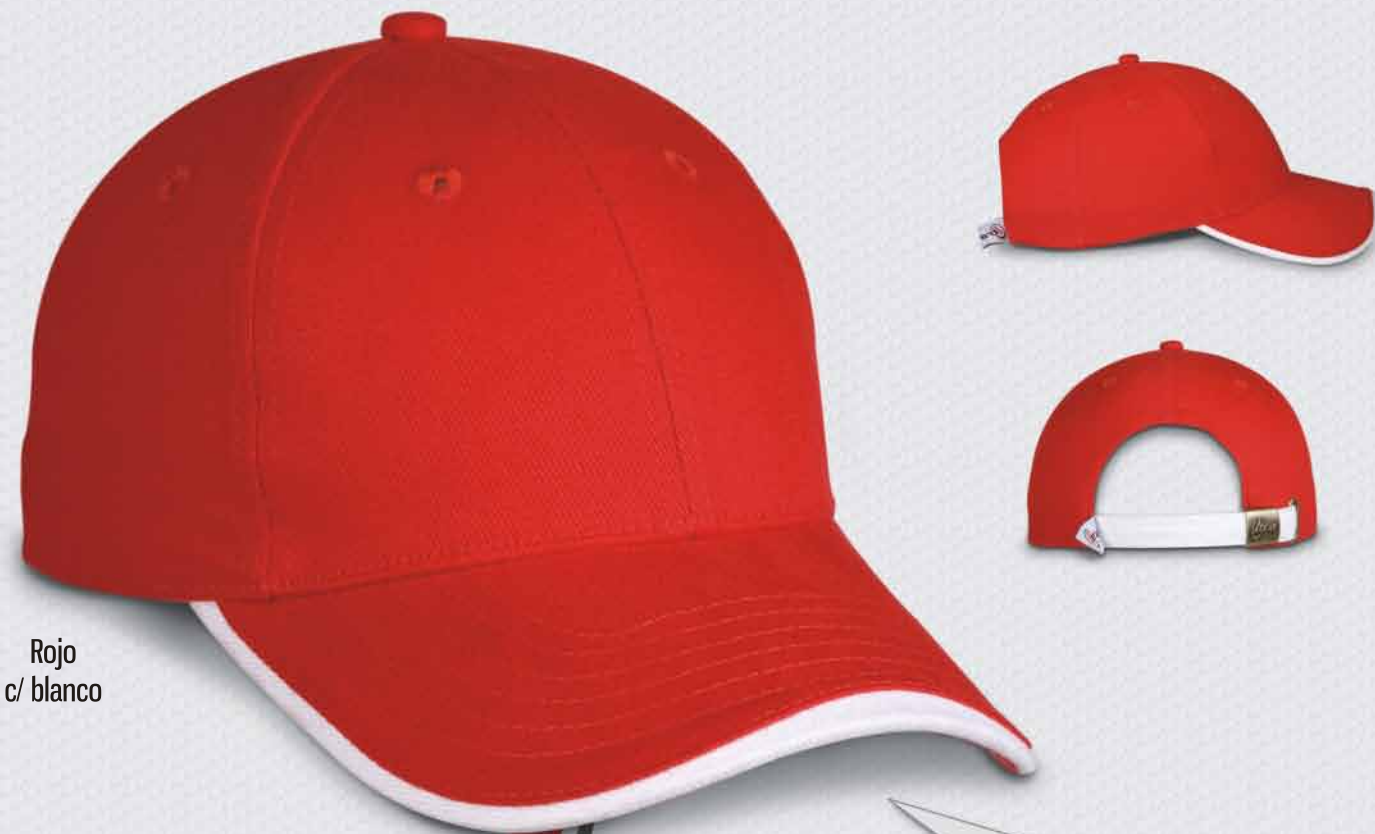
Rojo c/ blanco