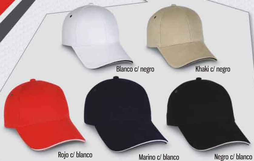
Blanco c/ negro