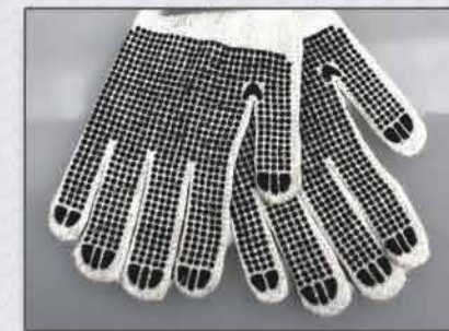
C/ bolitas de PVC / 2 lados