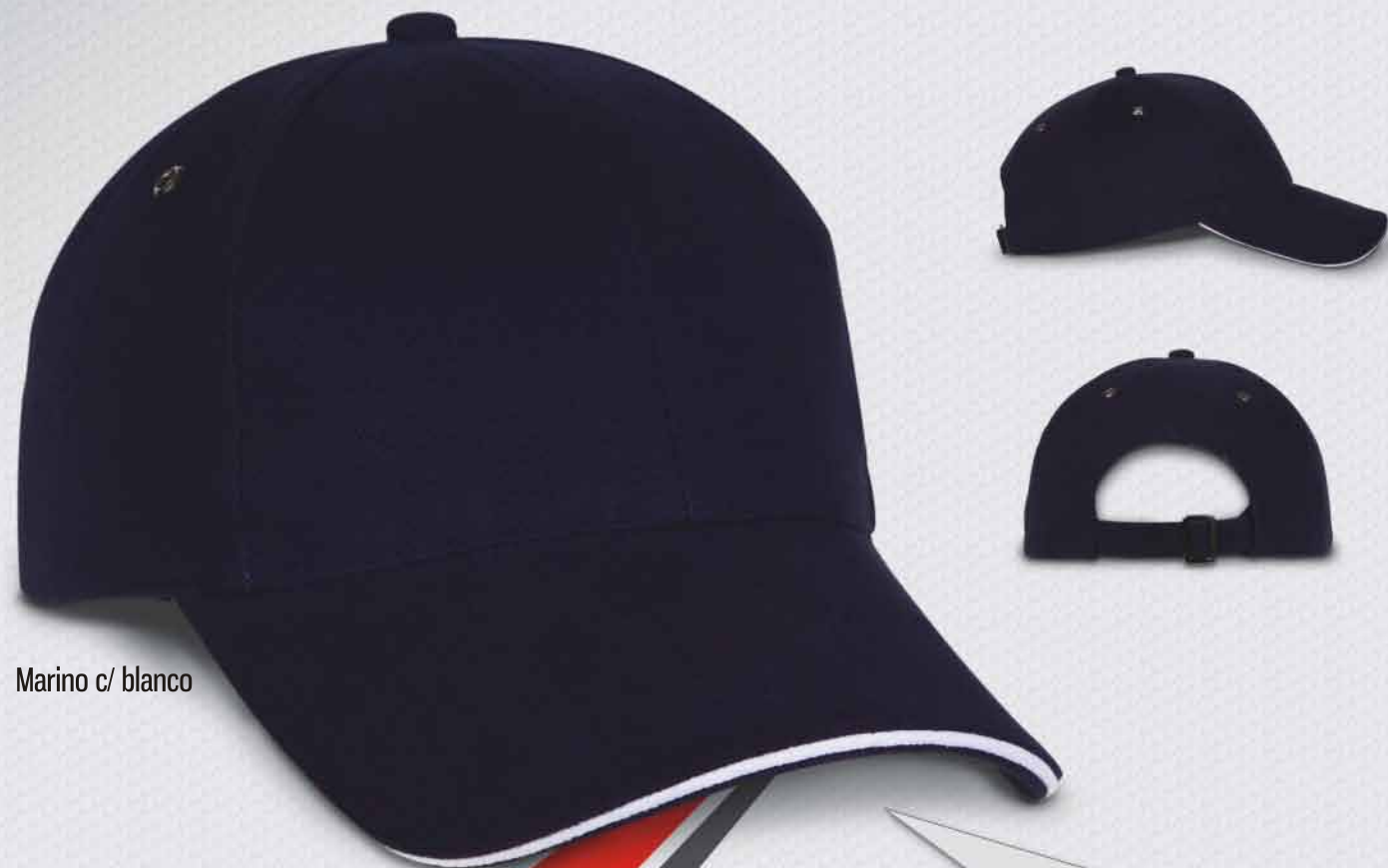
Marino c/ blanco