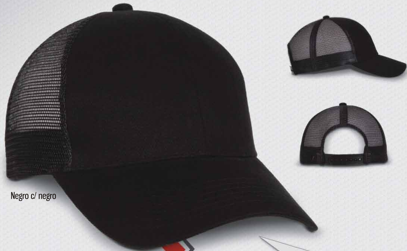
Negro c/ negro