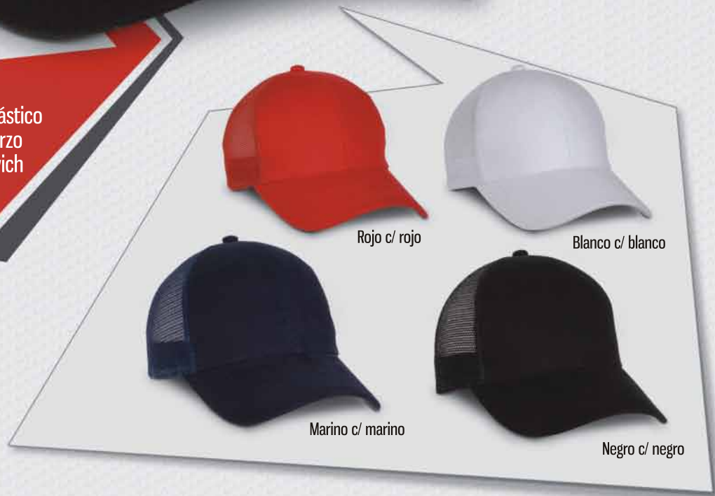
Rojo c/ rojo