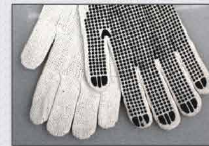
C/ bolitas de PVC / 1 lado