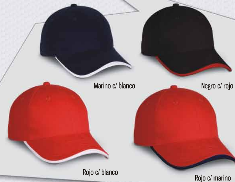
Marino c/ blanco