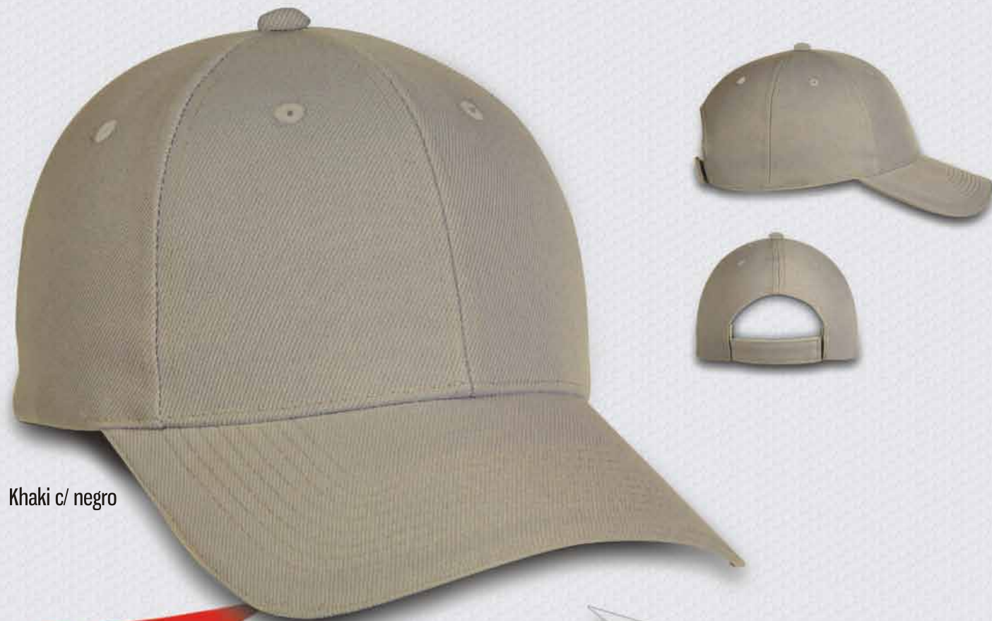
Khaki c/ negro